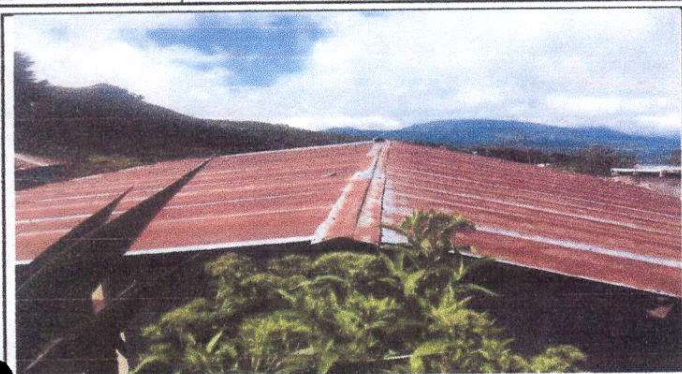
Foto1: lamina con perforaciones que necesitan ser cambiadas