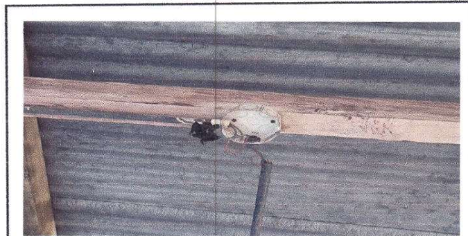
Foto 6. Reparación del cableado eléctrico

Observación: Si es necesario se pueden agregar hojas adicionales, pero no se debe superar el número de hojas.