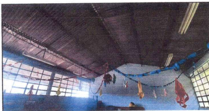
Foto 3: lamparas y plafonera en mal estado que necesitan ser sustuidas y mejorar todo el sistema electrico que está en mal estado.